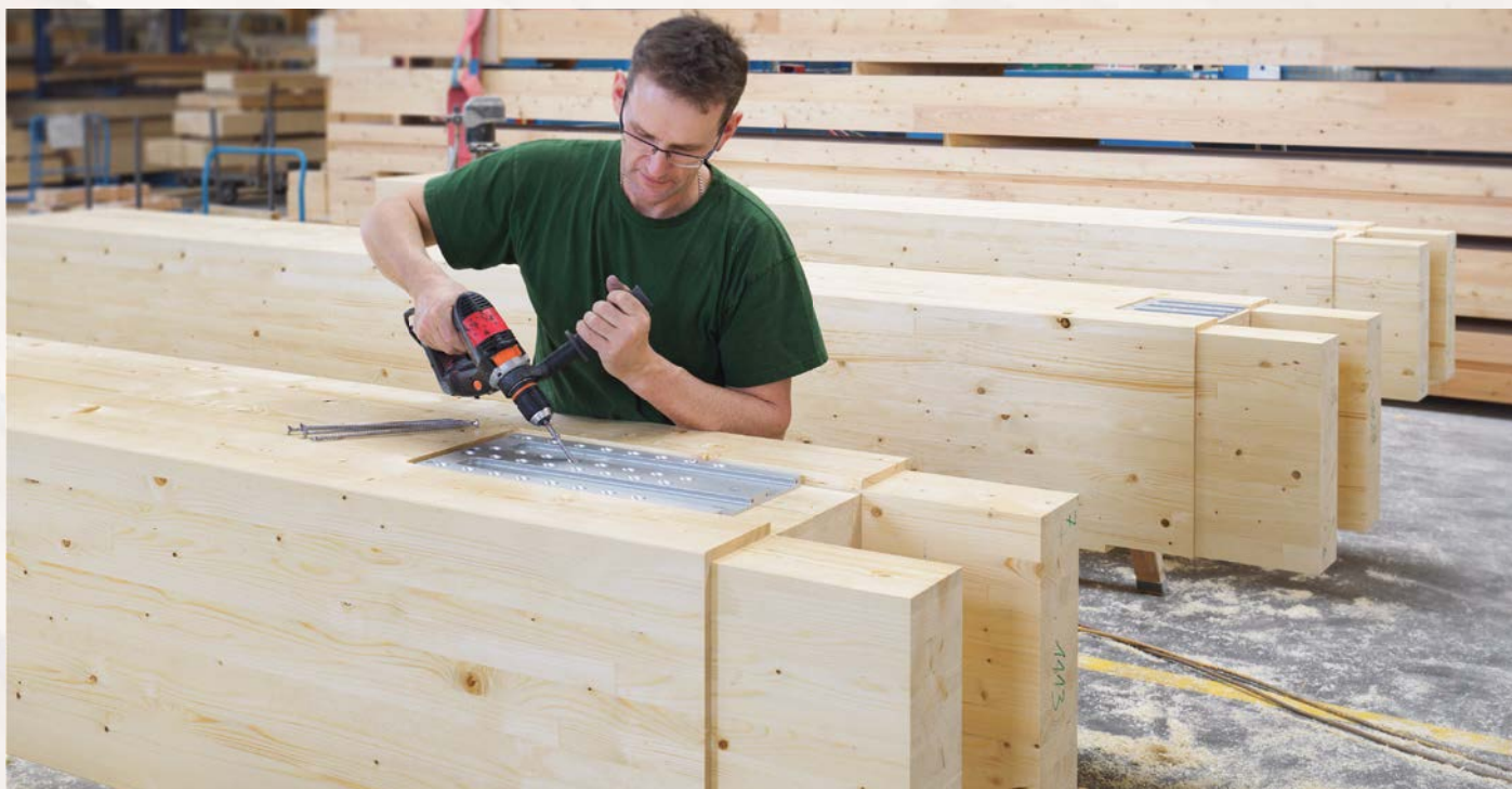
Abbund bei Wiehag in Altheim: Rund 6000m 3 Brettschichtholz für 1900 Stützen und 1660 Träger in- klusive vormontierter Verbindung- mittel gelangten nach Singapur.